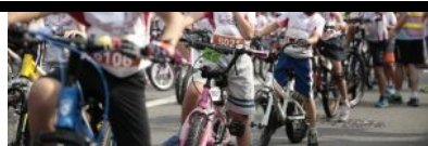
【單車節·圖輯】上橋落坡 轉急彎 熱烈風火輪碌勻...