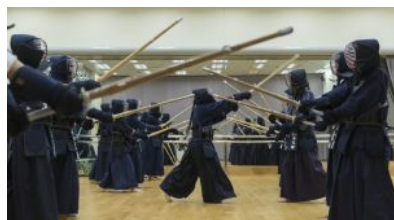
【圖輯】宏大的劍道精神 認識自己內心的修行