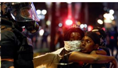
【國際影像】美國警察槍殺 黑人抗議升級 示威者中...