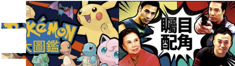
【首館】Pokemon Go 【專頁：香港最強綠葉】娛樂工業中的配角們 你今...