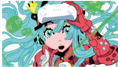
東京遊戲展直擊：新遊戲試玩 場內Show Girl圖集