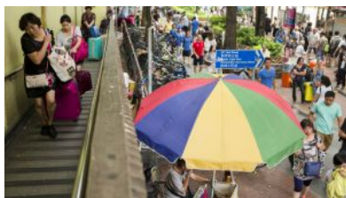
【上水故事·圖輯】在北一 方之日常