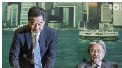
【橫洲記招】梁振英曾俊華 罕有同場 鏡頭下的特首...