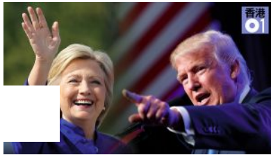
【大選專頁】希拉里vs 唐納德 世紀之戰如何衝...