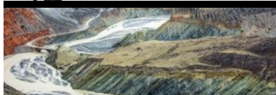
【影展消息】NatGeo得獎 港人攝影師 探索中國自...